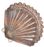
Vieira de la Bahía

1. ¡Este molusco puede nadar y tiene hasta 40 ojos azules que ven claro y oscuro!