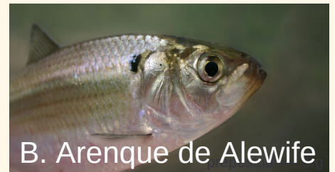
B. Arenque de Alewife