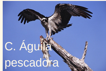
C. Águila pescadora