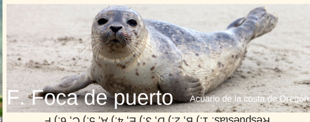
F. Foca de puerto