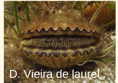
D. Vieira de laurel