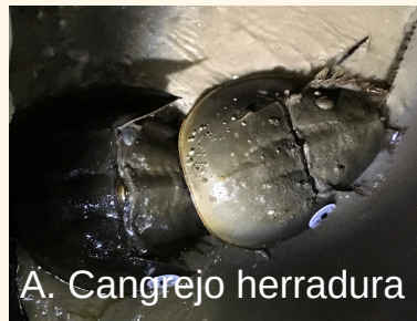
A. Cangrejo herradura